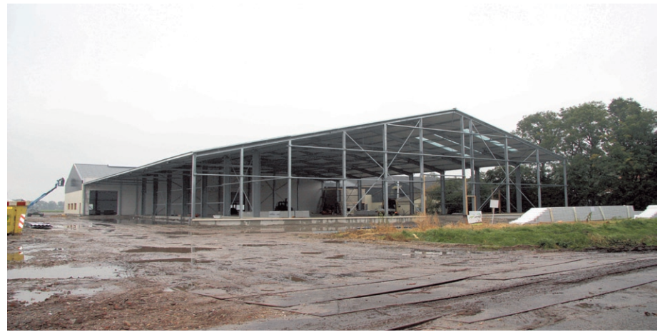
Dankzij de nieuwe oprit lopen bouwvakkers en bollenkwekers elkaar niet in de weg.